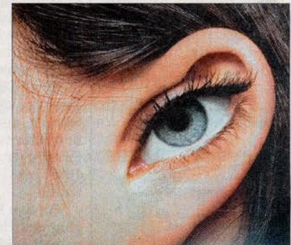
Mit den Augen hören sollen die Besucher, fordert ein Werbeplakate für die Ausstellung.