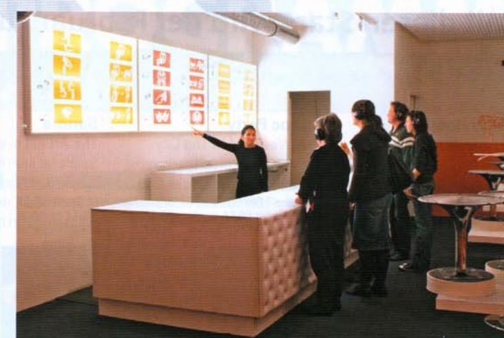
An den Stationen geben die Besucher vollen Körpereinsatz – ob mit Mimik auf Bilder zu reagieren, in Gebärdensprache eine Cola zu bestellen oder eine Kuh zu interpretieren.

Nachhinein begreifen wir den Anfang der Führung richtig, als wir gemeinsam unsere Finger gelockert und Schattenspiele gemacht haben: Gebärdensprache ist die einzige Sprache auf der Welt, die Schatten wirft. jo